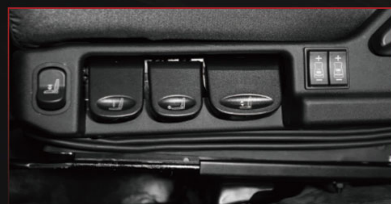
人体工程学气囊减震座椅 降低驾驶疲劳感