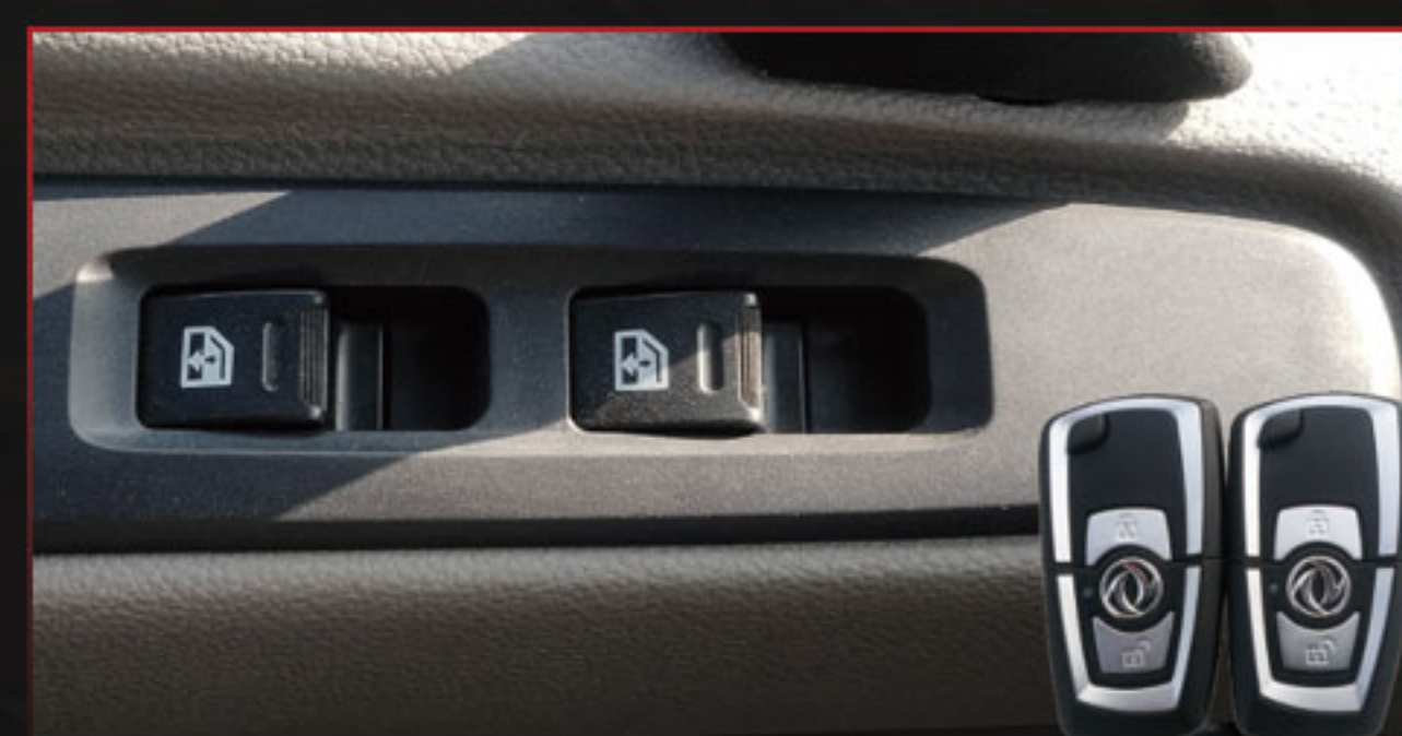
电动车窗，中控门锁，操作方便快捷