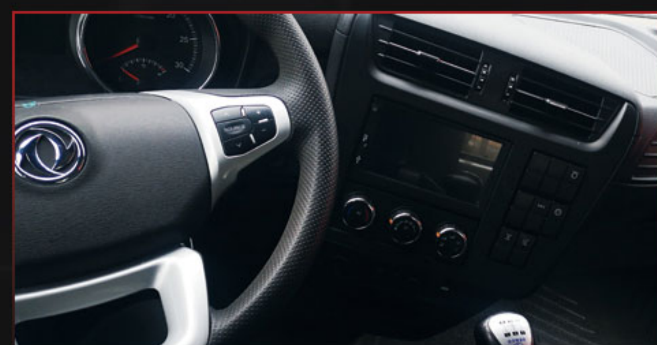
标配多媒体大屏车辅数据实时掌控